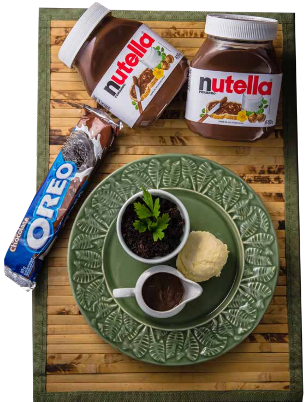
BONSAI DE NUTELLA E OREO