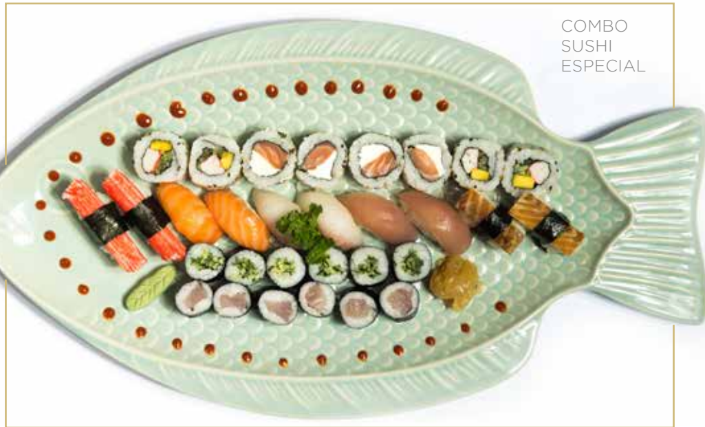
COMBO SUSHI ESPECIAL