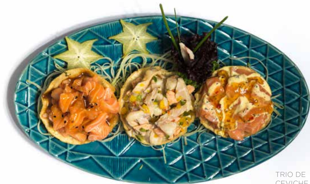
TRIO DE CEVICHE