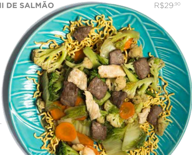
YAKISSOBA TRADICIONAL 1 PESSOA