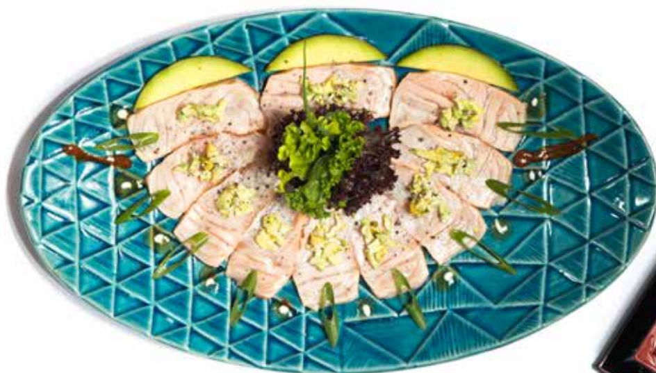
SALMÃO SELADO ESPECIAL